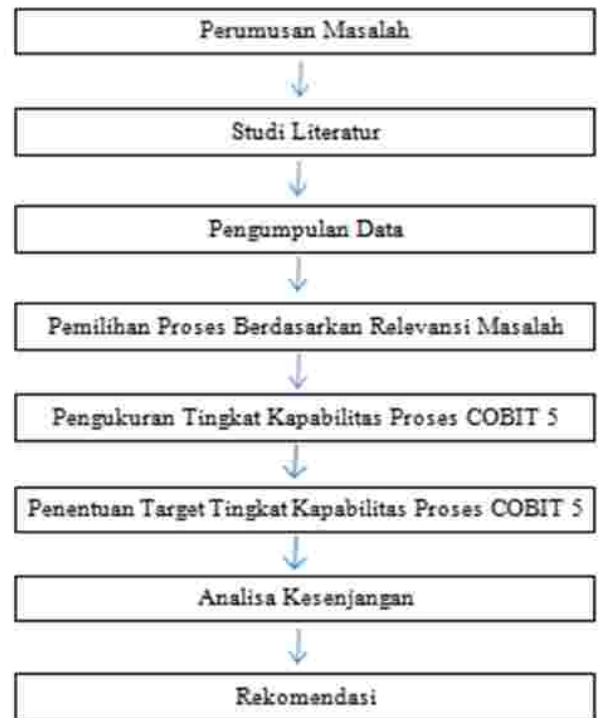
Gambar 1. Metodologi penelitian

Tahapan yang akan dilakukan dalam penelitian ini dapat dilihat pada gambar1 berikut ini :