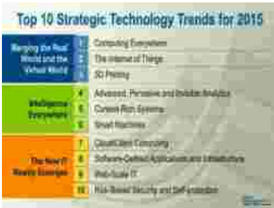
Gambar3. Tren IT 2015 versi Gartner

Analisa lingkungan eksternal SI/TI dilakukan berdasarkan analisa tren teknologi masa kini.Lembaga riset teknologi informasi Gartner menyoroti atas 10 tren teknologi yang strategis bagi sebagian besar organisasi ditahun 2015.Hal ini dikemukakan selama Gartner Symposium/ITxpo pada tanggal 06 Desember 2015.