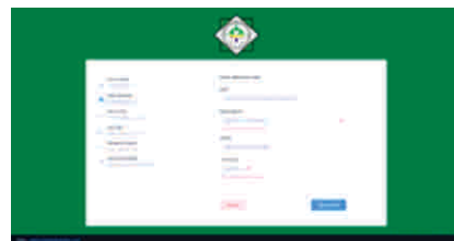
Gambar 5 Tampilan halaman pendaftaran input data sekolah asal