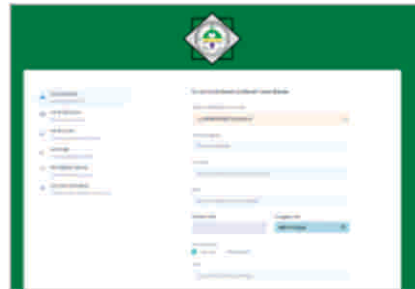
Gambar 4 Tampilan halaman pendaftaran

Pada halaman menu informasi, peserta dapat melakukan pendaftaran dengan mengklik tombol daftar dan mengisi form pendaftaran dengan lengkap dan benar seperti gambar berikut :