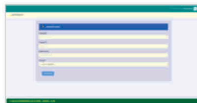
Gambar 11 Tampilan halaman input data panitia

Input data panitia hanya dapat diakses oleh KEPSEK, data panitia merupakan master data untuk user akses ke sistem, tampilannya seperti gambar berikut :