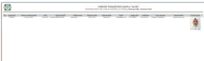
Gambar 16 Laporan penerimaan santri baru

KEPSEK juga bisa mencetak laporan data dari hasil penerimaan santri baru