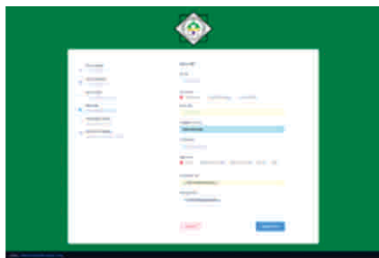
Gambar 7 Tampilan halaman pendaftaran input data ibu