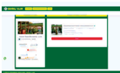
Gambar 2 Tampilan halaman informasi

Pada halaman ini peserta akan memperoleh informasi penerimaan santri baru pada Pondok Pesantren Bahrul Ulum. Pada informasi penerimaan tersebut memberikan informasi penerimaan, tanggal pembukaan penerimaan dan Kuota penerimaan seperti gambar berikut :