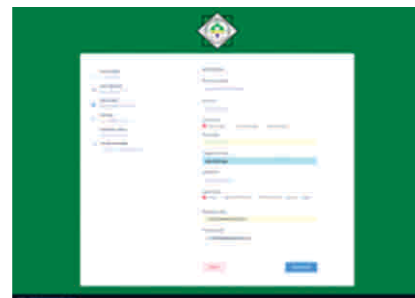
Gambar 6 Tampilan halaman pendaftaran input data ayah