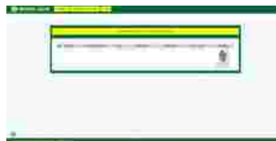
Gambar 12 Tampilan halaman pengumuman kelulusan

Untuk halaman pengumuman kelulusan akan menampilkan peserta penerimaan santri baru yang lulus berdasarkan penerimaan santri baru. Adapun tampilannya adalah sebagai berikut :