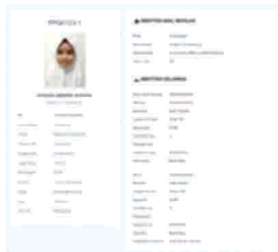
Gambar 13 Tampilan output laporan detail data santri

Halaman data peserta ini digunakan untuk memudahkan mengecek profil data santri. Berikut form profilnya :