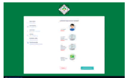
Gambar 9 Tampilan halaman pendaftaran upload dokumen

Setelah berhasil melakukan pendaftaran, aplikasi akan mengirimkan secara otomatis link bukti pendaftaran yang dapat juga langsung dicetak saat peserta berhasil melakukan pendaftaran, seperti gambar berikut :