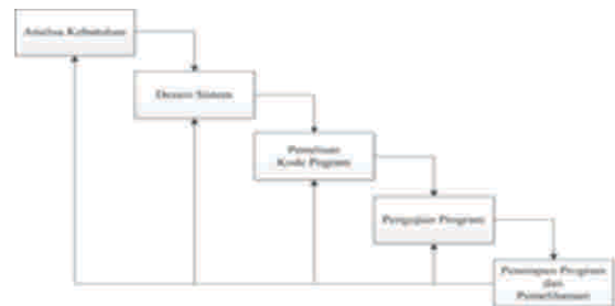
Gambar 1 Metode Waterfall

Model Sekuensial Linear atau Waterfall Development Model. Model Sekuensial Linear atau disebut model air terjun, merupakan paradigma model pengembangan perangkat lunak paling tua, dan paling banyak dipakai. Mengusulkan sebuah pendekatan perkembangan perangkat lunak yang dimulai pada seluruh tahapan analisis, desain, kode, pengujian dan penerapan program.