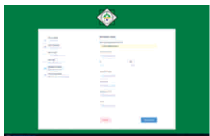
Gambar 8 Tampilan halaman pendaftaran input data informasi umum