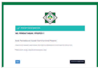
Gambar 10 Tampilan halaman hasil pendaftaran

Setelah berhasil melakukan pendaftaran, aplikasi akan mengirimkan secara otomatis link bukti pendaftaran yang dapat juga langsung dicetak saat peserta berhasil melakukan pendaftaran, seperti gambar berikut :